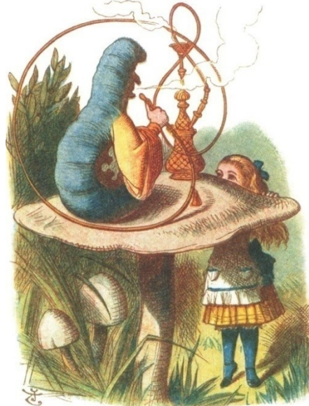
Figura 2: Alice encontra a Lagarta de Narguilé. Ilustração de John Tenniel.