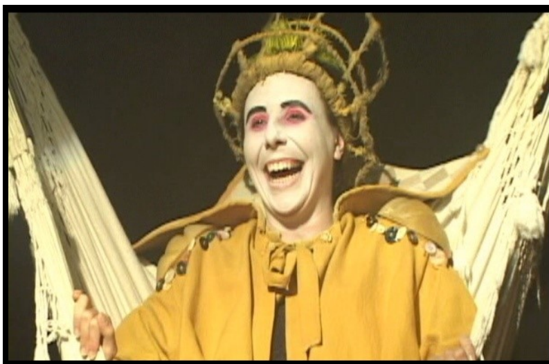
Figura 5: O Chapeleiro.

Fonte: DVD Alice através do espelho pelo grupo Armazém Companhia de Teatro (2014)