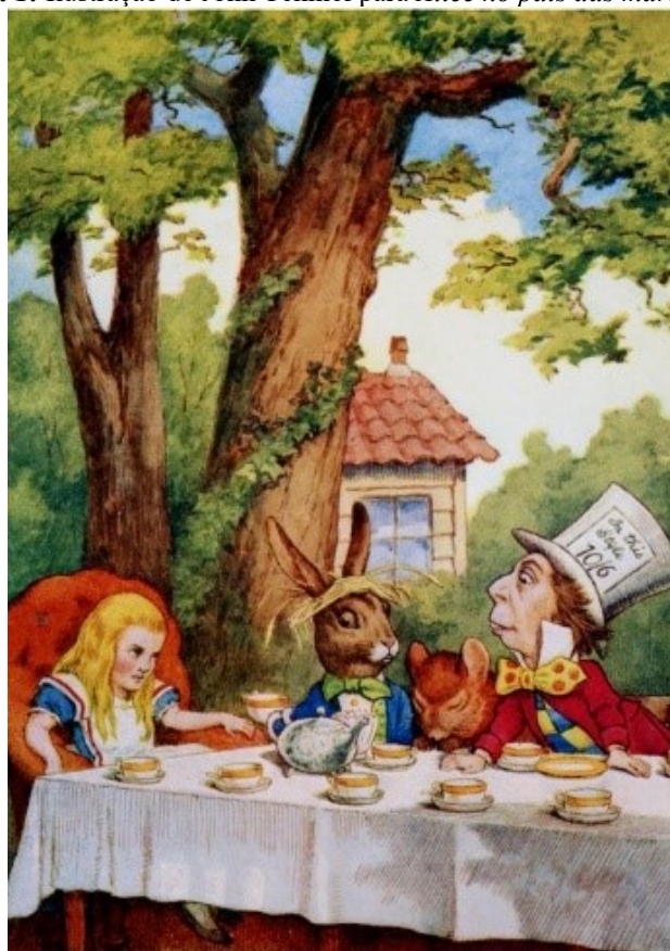
Figura 1: Ilustração de John Tenniel para Alice no país das maravilhas .